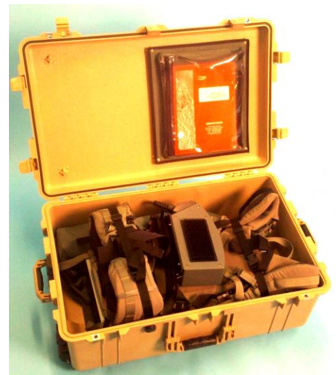
G-858 y GPS en caja de embarque reutilizable con acojamiento ruedas para traslado