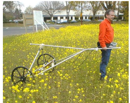
Carro No-Magnético para búsqueda objetos